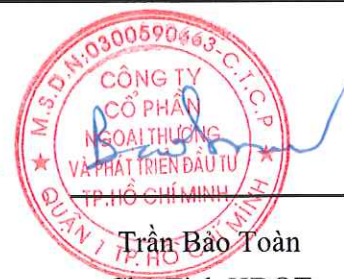
Trần Bảo Toàn Chu Tịch HĐQT Ngày 26 tháng 01 năm 2018