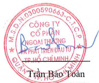
Trần Bảo Toàn Chủ Tịch HĐQT